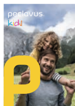
peclavus® kids Milde Kinderpflege mit Spaßfaktor