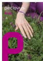
peclavus® hand Natürlich schön gepflegte Hände