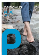
peclavus® PODOmed Wirksame Hilfe bei Fußproblemen