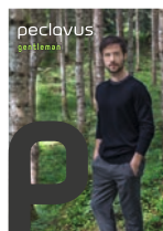
peclavus® gentleman Natürliche Körperpflege für den Gentleman