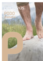
peclavus® PODOdiabetic Sanfte Pflege für sensible Füße