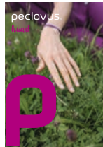
peclavus® hand Natürlich schön gepflegte Hände