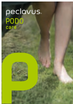
peclavus® PODOcare Fußgesundheit ganz natürlich