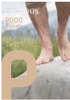
peclavus® PODOdiabetic Sanfte Pflege für sensible Füße