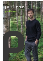
peclavus® gentleman Natürliche Körperpflege für den Gentleman