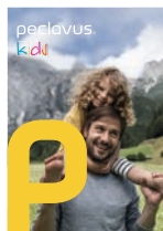
peclavus* kids Milde Kinderpflege mit Spaßfaktor