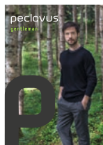
peclavus* gentleman Natürliche Körperpflege für den Gentleman