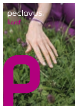
peclavus* hand Natürlich schön gepflegte Hände