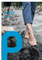
peclavus* PODomed Wirksame Hilfe bei Fußproblemen